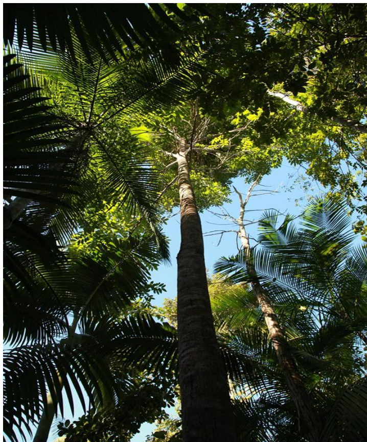
Figura 3. Agrofloresta (B) instalada em 1997, após 15 anos. Barra do Turvo-SP. 2014. Fotografia: Soraya Rédua.

Portanto, o manejo de agroflorestas agroecológicas dos associados da Cooperafloresta é um exemplo do modelo de “ land sharing ” de conservação da natureza, onde existem dois mecanismos, um formador de agrofloresta stritu sensu e outro de capoeira, ocupando atualmente 74% da paisagem das áreas das famílias agricultoras.