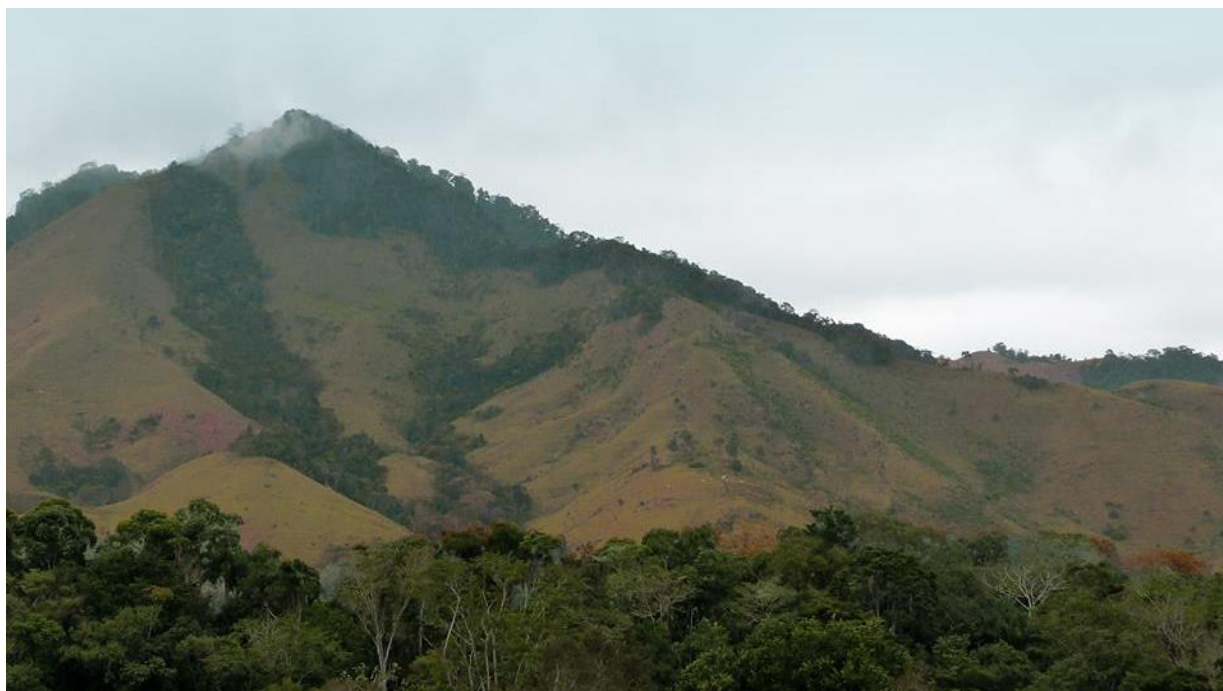
Figura 1. Paisagem típica do município de Barra do Turvo-SP e do município vizinho de Adrianópolis - PR: um mosaico composto de remanescentes florestais em regeneração e áreas degradadas com agricultura de subsistência itinerante baseada em derruba-e-queima e pastagens extensivas. Barra do Turvo-SP. 2014.

precipitação média anual variando de 1.500 mm a 2.000 mm, temperatura média anual de 21,5 °C e apresenta 70% de seu território em remanescentes da Floresta Ombrófila Densa Atlântica (ROUSSELET-GADENNE, 2004). Os usos do solo prevalentes nos dois municípios de atuação da Cooperafloresta, Barra do Turvo e Adrianópolis, são extremamente opostos: 45% das áreas cobertas com Mata Atlântica (SOS Mata Atlântica, 2013) e o restante é composto por um mosaico dominado por agricultura de subsistência itinerante baseada em derruba-e-queima e pastagens extensivas e degradadas após o rápido esgotamento dos terrenos (figura 1). É a região mais pobre do Estado de São Paulo e uma das mais pobres do Paraná (STEENBOCK et al., 2013a).