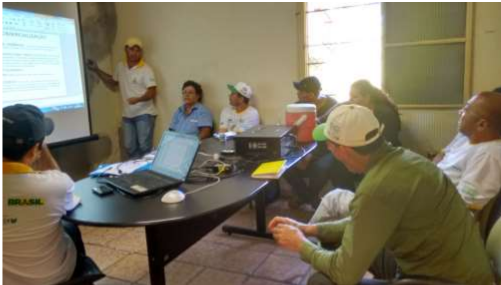
Figura 3. Reunião do Comitê de Comercialização da Rede de Agroecologia APOMS, em Dourados, MS.

O projeto custeado pela Petrobras, visando implementar o sistema participativo de garantia, está findando. Entretanto, a APOMS aprovou novo projeto junto ao Programa de Fortalecimento e Ampliação das Redes de Agroecologia, Extrativismo e Produção Orgânica (Ecoforte), com recursos da parceria da Fundação Banco do Brasil (FBB) com o Banco Nacional de Desenvolvimento Econômico e Social (BNDES). Os recursos em todo Brasil tem beneficiado cerca de 20 mil famílias de assentados da reforma agrária, agricultores familiares, indígenas, povos e comunidades tradicionais.