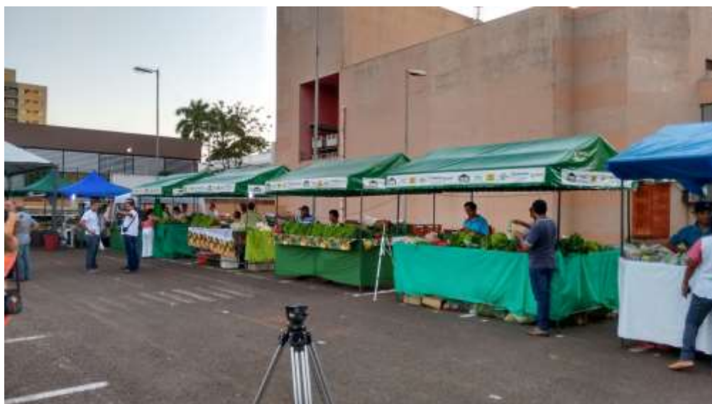
Figura 4. Feira agroecológica realizada semanalmente no Parque dos Ipês, em Dourados, MS, em 2015.

O recurso da chamada pública da Petrobras Sustentabilidade viabilizou a implantação do projeto de certificação participativa da Rede de Agroecologia APOMS, pois foi possível investir em capacitações e visitas técnicas, além de investimentos de bens materiais para aprimorar o processo certificador.