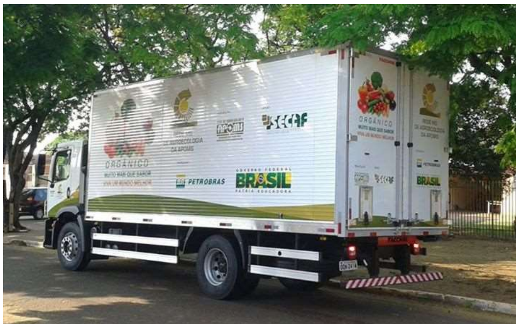
Figura 2. Caminhão adquirido pela Rede de Agroecologia APOMS por meio de um projeto custeado pela Petrobras.

Como parte das atividades inerentes a esse projeto, os grupos produtivos estão sempre trocando experiências e tirando dúvidas, através de mídias sociais e presencialmente, por ocasião das reuniões.